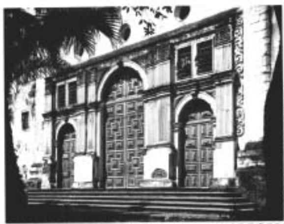
Fachada principal da igreja da Sé

A construção da primeira catedral brasileira foi iniciada em 1552, no governo de Tomé de Souza e estendeu-se a outras administrações tendo sido finalizada no século XVIII. A primeira proposta de demolição consta ter sido no governo de Gaspar de Souza no século XVII. (PERES, 1973).