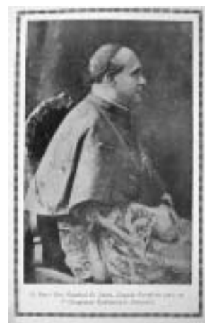
Cardeal Dom Leme

Não foi sem motivo que o Primeiro Congresso Eucarístico ocorreu, justamente, durante a semana comemorativa à pátria, de 3 a 10 de setembro de 1933. Realizou-se em Salvador, sendo o presidente da comissão organizadora, o Arcebispo da Bahia e Primaz do Brasil, Dom Augusto Álvaro da Silva. Menos coincidente ainda foi a tônica dos discursos e teses apresentadas no Congresso: a pátria e a fé católica da nação brasileira, que reuniu as personagens mais proeminentes do clero nacional. Entre eles: Cardeal Sebastião Leme, que além de ser o Arcebispo do Rio de Janeiro, presidiu o evento como Legado Pontifício, isto é, a pessoa que preside em nome do Papa; D. João Becker, Arcebispo de Porto Alegre; D. Antônio Cabral, Arcebispo de Belo Horizonte; Pe. Leonel Franca; Pe. Luiz Gonzaga Cabral. O Núncio Apostólico da Santa Sé no Brasil, D. Bento Aloysi Masela também esteve presente, como