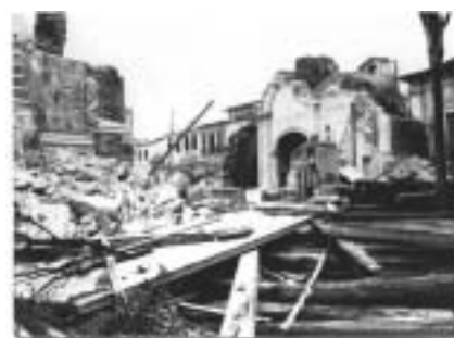
Vistas parciais da demolição da igreja da Sé