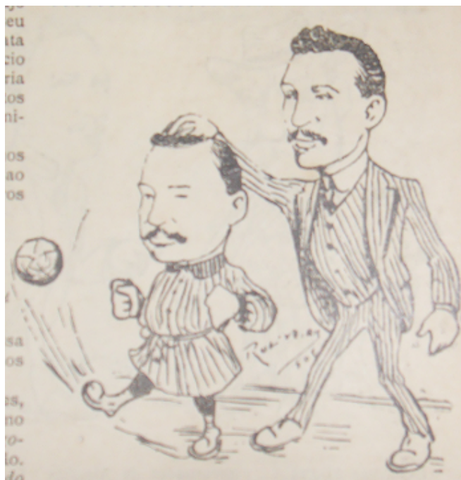
FIGURA 3 - Caricatura com E. Malta e J. J. Seabra jogando futebol, Revista do Brasil, 30/08/1906.

A oportunidade de conquistar mais uma vez o coração dos baianos seria em uma partida realizada entre a seleção da LBST e o clube africano South-African. O Diário de Notícias anunciou que o jogo era o grande evento do ano. Colocou a escalação da seleção baiana e pediu a presença de um maciço público, mesmo sendo a partida em um horário impróprio. O jogo seria realizado às 6 horas da manhã, pois o navio que deveria partir em viagem com os sul-africanos sairia naquele mesmo dia. Apesar do horário ingrato, mais de 1000 pessoas se deslocaram para o local do jogo, chegando a contar com a presença de uma banda da polícia militar. O problema é que o jogo não aconteceu. Nada tinha sido acordado entre a LBST e o suposto time estrangeiro. Coube ao jornal pedir desculpas às pessoas iludidas por uma brincadeira. 221