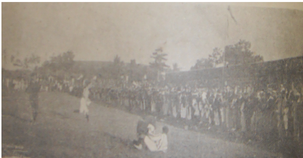
FIGURA 4 - Vitória x São Salvador, Revista do Brasil, 30/08/1908.

A partida entre o Vitória e o São Salvador, realizada no dia 12 de julho, foi a única daquele ano, que obteve uma boa atenção da imprensa e do público. Ao que parece, a LBST preparou uma grande festa para tentar amenizar os problemas que assolavam a instituição. Segundo os jornais, a partida foi uma grande festa, contando com a graça da Filarmônica 7 de setembro, que alegrou as senhoras da mais seleta sociedade baiana. Apesar dos muitos aplausos concedidos aos jogadores, o que chamou a atenção não foi a satisfação em relação ao jogo, mas o descontentamento com o sistema de transporte, que tinha sido bastante elogiado no ano anterior.