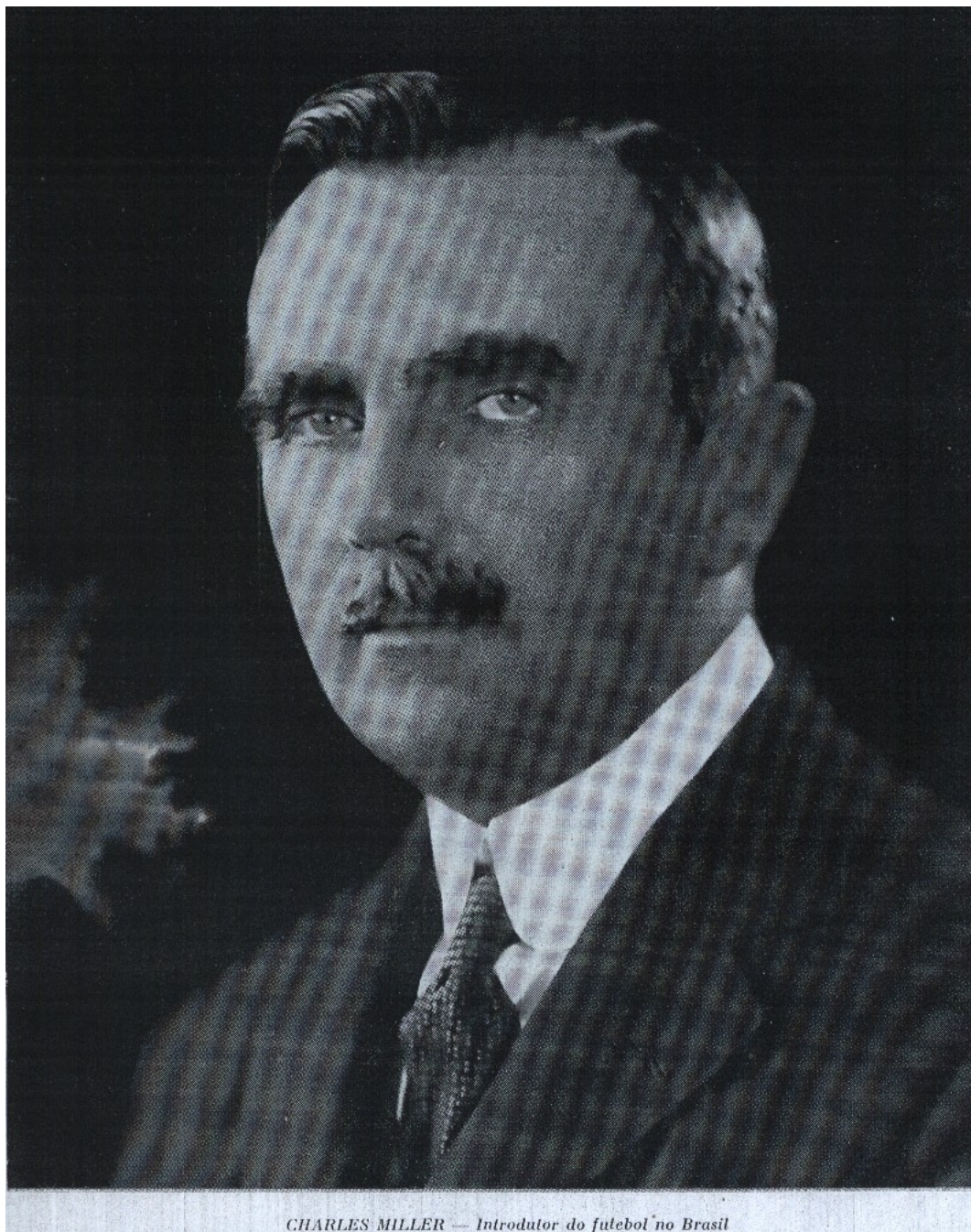
FIGURA 1 - Retrato de Charles Muller.

Para Mazzoni, além de introdutor, Muller teria sido o grande propagador e incentivador do esporte no Brasil. O sucesso do futebol, por aqui, teria sido fruto direto dos esforços seus e de seus amigos, todos jovens da elite da capital paulista. Nesse tipo de abordagem, percebemos que não é só atribuída às elites a introdução do futebol no país, mas também é colocada como