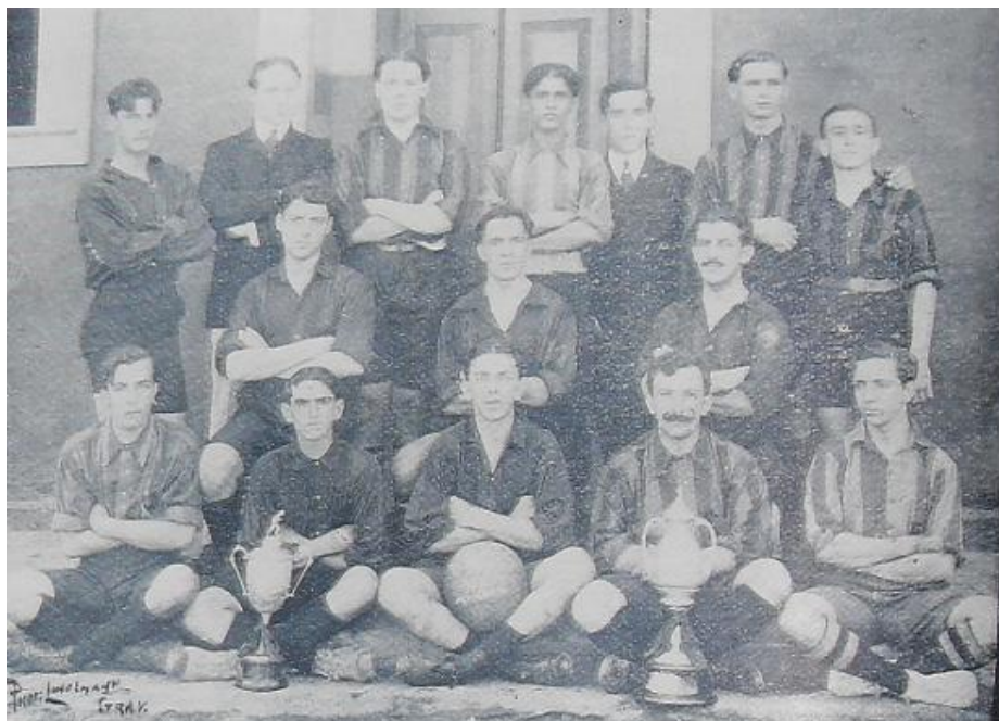
FIGURA 2 - Time do Vitória em 1908, Revista do Brasil, 30/12/1908.

Uma forte crise caiu sobre a LBST, que esperava que o Internacional voltasse ao campeonato. Notícias circulavam nos jornais afirmando o descontentamento da Liga em relação à postura dos ingleses. Dias depois, eram desmentidas por um outro jornal, que afirmava serem falsas. 201 Ao que parece, contudo, muitos membros da instituição reprovavam a postura irredutível dos ingleses de não voltarem a disputar o campeonato, já que providências estavam sendo tomadas no sentido de evitar novos problemas.