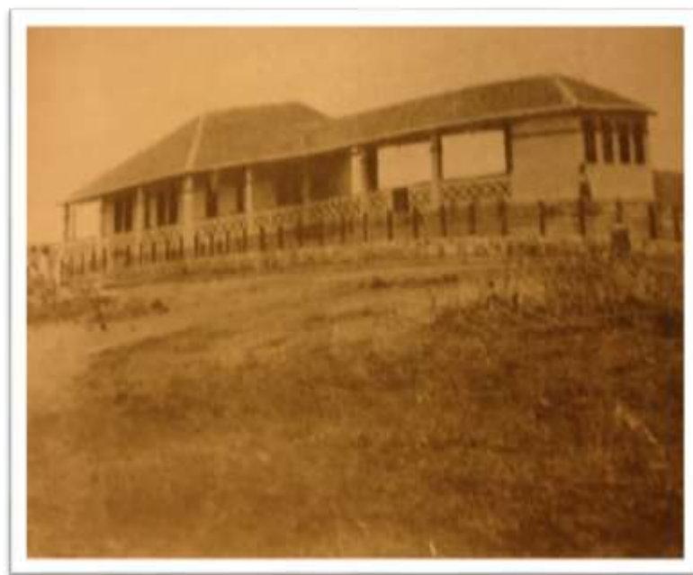
Figura 10. Modelo de escola de alvenaria do DNOCS. (Açude Curema).

As escolas tinham como meta ensinar as primeiras letras, mas também abordar conhecimentos relacionados à agricultura e à pecuária. Eram matriculados meninos e meninas, estas em maior número e frequência nos relatórios, e as aulas eram ministradas nas dependências do grupo escolar, mas também no campo. Hermosea menciona, em entrevista, que a escola de Pentecoste tinha pleno funcionamento e era aberta a todos os filhos de trabalhadores fixos e temporários residentes no acampamento da obra. Entretanto, tanto o quadro acima como o depoimento de Hermosea cooperam para o entendimento de que, mesmo as matrículas sendo inclusivas a todas as crianças, o número de alunos era bastante modesto se comparado às numerosas famílias que ali habitavam.