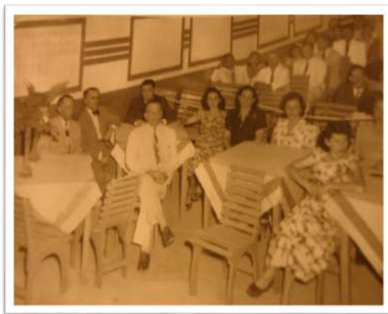
Figura 9. Cinema do açude Orós.

De qualquer modo, pôde-se perceber que existiu um lazer institucionalizado voltado aos trabalhadores com referências do catolicismo popular e com permanências de costumes habituais das comunidades interioranas. Festas de santos, Natal e batizados ocorriam regularmente nos acampamentos, sob organização das funcionárias fixas do DNOCS e esposa do engenheiro. Paulo Guerra, em Flashes das Secas , também faz referência às festas religiosas, mencionando, em acréscimo, a existência de comemorações cívicas que, segundo ele, contavam com a participação dos operários.