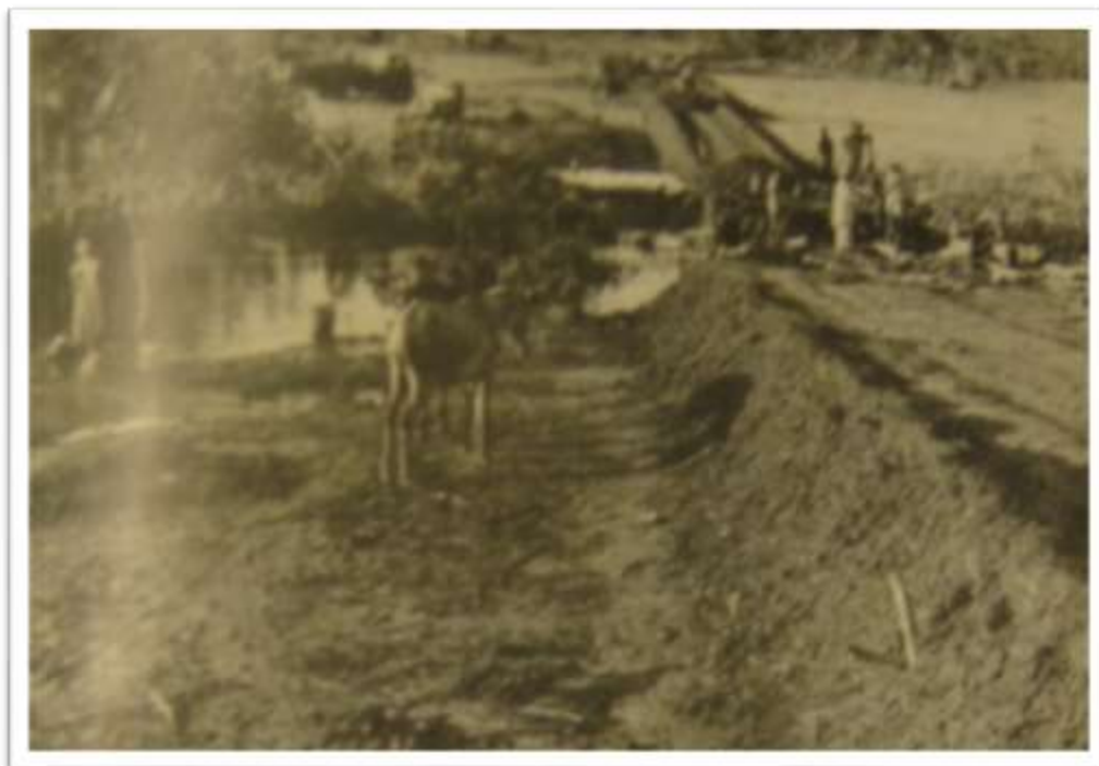
Fotografia 1. Trecho da construção da rodovia Nordeste-Brasília.