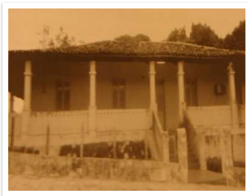
Figura 2. Modelo padrão de residência para engenheiros. Fotografada anos depois da conclusão do açude Curema. Fonte: CARVALHO, Emmanoel Rocha. Barragens de Curema e Mãe D'água: nos bastidores da construção . João Pessoa: edição do Autor, 2013, p.107.

A casa do encarregado da construção ficava localizada geralmente em um dos pontos mais altos do terreno. De lá era possível ter uma visão panorâmica, observar a movimentação de carros, máquinas e os trabalhadores-cassacos; tudo em seu vai-e-vem. Comparada às moradias dos técnicos, essa residência possuía cômodos espaçosos, pois, guardada algumas variações, totalizava cerca de 200 m 2 , possuindo inclusive espaço para guardar um jipe. Erguida com tijolos, cimento e telhas, passava por reformas sempre que se julgava necessário. Internamente, destacava-se pela limpeza, energia elétrica, água encanada, telefone, sendo que em algumas havia até jardins. Era, portanto, uma habitação privilegiada para os padrões do semiárido em crise de estiagem. Tudo cooperando para o conforto de um profissional, visto como caro e necessário à administração dos combates às estiagens. Nas proximidades desta, localizavam-se as moradias dos funcionários da administração, equipe técnica e trabalhadores especializados.