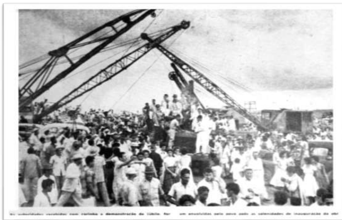
Fotografia 10. Engenheiros na construção do açude Pentecostes