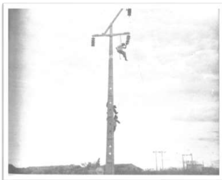
Figura 15. Trabalhadores na Instalação de Redes de Eletricidade.

Além das precariedades de subsistência e saúde nas frentes de serviço, pode-se considerar que o DNOCS, em diversas situações, também assumiu os riscos de colocar em perigo a vida dos seus trabalhadores, sobretudo quando se observam os casos de “acidentes” de trabalho, pois além de esgotados e mal alimentados, os trabalhadores labutavam de sol a sol, frequentemente sem equipamentos de segurança adequados, mesmo em serviços onde havia ameaça direta de eventos fatais, como a instalação de linhas de energia e perfuração de túneis, conforme imagem abaixo.