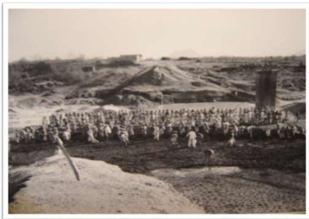
Fotografia 3. Trabalhadores na reconstrução do açude Patos (CE-dezembro de 1953)