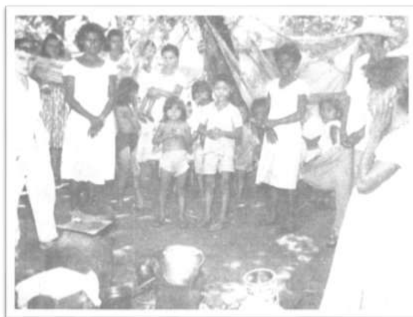
Figura 12. Famílias no acampamento. Na parte inferior da figura utensílios utilizados no preparo das comidas.

(FISI). Mais tarde, sob os cuidados das barraqueiras ou barraqueiros – função ocupada geralmente por trabalhadores mais velhos – ou ainda de esposas e filhas que permaneciam nos alojamentos, fervia-se o feijão, acompanhado de farinha e rapadura, para o almoço. Este almoço, que variava pouco e era consumido em pequenos ou maiores bocados, a depender do tamanho do grupo, era servido coletivamente entre onze e doze horas, logo depois do fim do primeiro turno de trabalho. 344 Muitos trabalhadores possuíam nesse alimento a refeição do dia, pois, por terem migrado sozinhos, precisavam guardar “o saldo do barracão” para suas famílias que ficavam a léguas de distância dos canteiros das construções, conta o engenheiro Paulo Guerra. Este era justamente o motivo para José Ferreira e outros colegas abrirem mão do jantar, já que, se comessem duas vezes, não sobraria quase nada para os parentes, conta ele.