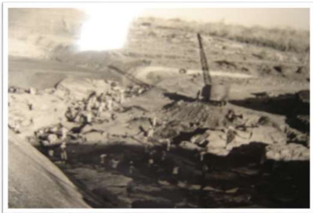
Fotografia 4. Trabalhadores na Cava de Fundação Açude Jucuruci (BA)