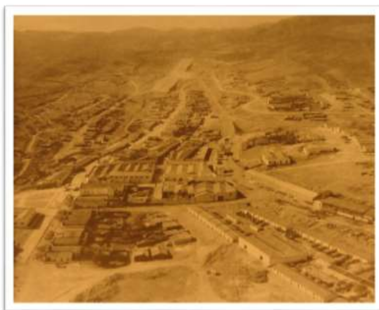
Figura 4. Estrutura do acampamento do Orós.