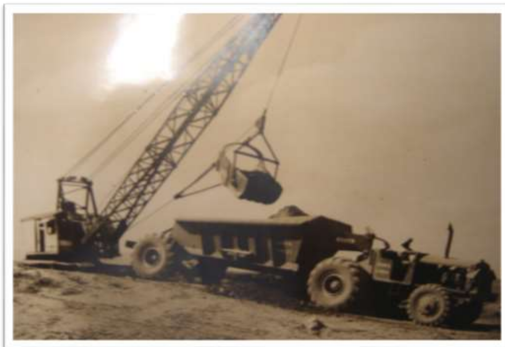
Fotografia 2. Máquina de escavação e transporte açude Pentecoste (CE)