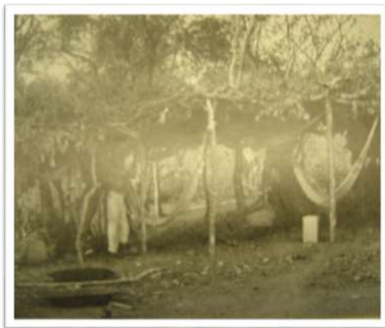
Figura 5. Alojamento de trabalhadores na seca de 1958.

Dessa forma, logo que eram alistados nas obras, os recém-chegados procuravam se abarracar como podiam. Os primeiros serviços executados pelos trabalhadores eram “as próprias construções dos abrigos”, com “estacas, varas e ramos, sendo poucos aqueles cobertos de zinco”. 219 Mesmo que relatórios de serviços executados incluam a construção desses barracões como parte das instalações do DNOCS, entende-se que, dependendo das habitações, além das diárias pagas aos operários pelos serviços executados, não existia qualquer outro dispêndio econômico à instituição, pois todo o material utilizado para as construções dessas barracas estava disponível nas proximidades do campo das obras, portanto os trabalhadores iam se alojando conforme a oportunidade e estratégias informais, muitas criadas por eles mesmos.