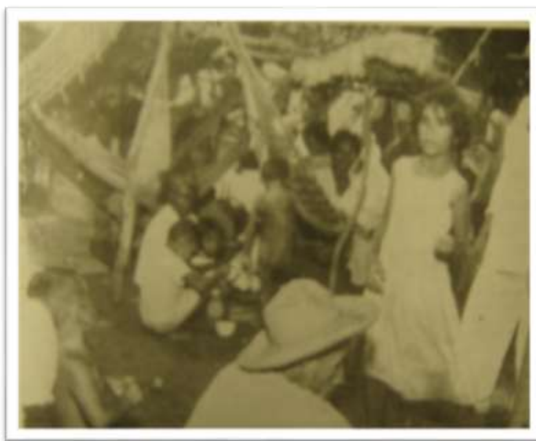
Figura 3. Famílias num alojamento na seca de 1958. Fonte: DNOCS. Boletim . Rio de Janeiro: MOV/P/DNOCS, v. 20, n.6, nov. 1959, p.5.

Em outro lugar, avistavam-se os barracões montados para os trabalhadores-cassacos. Geralmente reunindo turmas de cerca de 20 a 40 pessoas, as moradias dos trabalhadores eram feitas de troncos de árvores, ramos e folhas; uma ou outra era construída em taipa, cobertas de telhas de barro ou zinco. Alguns aspectos dos barracões lembravam o modo de vida sertanejo e a mobília combinava com a circulação constante desses sujeitos, resumindo-se a um amontoado de redes, muitas sobrepostas, um fogão de trempe, 202 uma ou outra panela, poucas mudas de roupas e malotes que também podiam ser usados como assento. Convivendo com o barulho de máquinas, passagem de veículos, com falta de limpeza e água, crianças, mulheres, velhos, homens, turmas de trabalhadores dividiam um espaço abarrotado e precário com suas famílias. 203