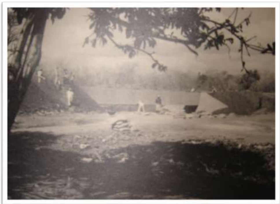
Fotografia 6. Turma na parede do açude Santa Maria (CE), (Em fase de conclusão).