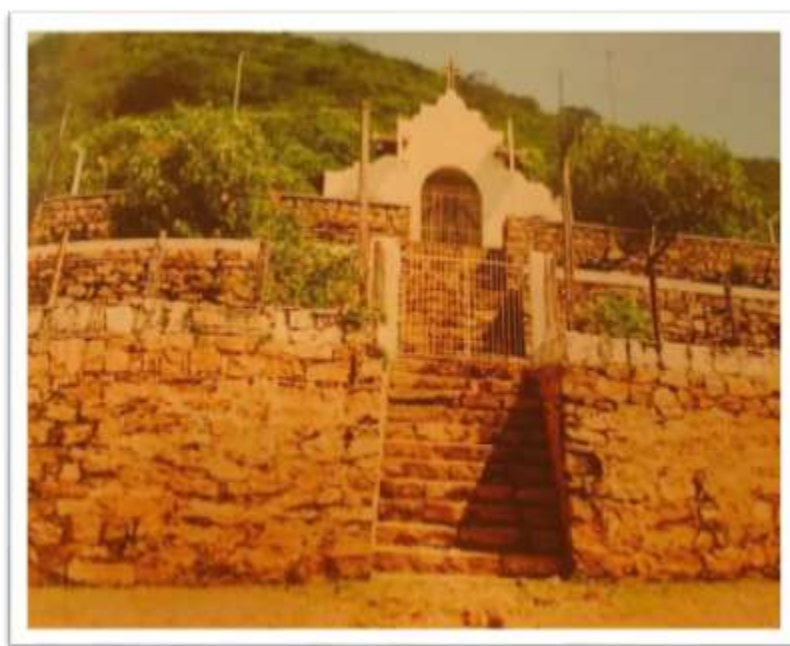
Figura 8. Capela do açude Curema-RN.