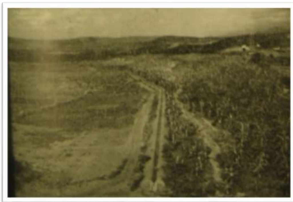
Fotografia 8. Posto agrícola General Sampaio (CE). Bananeiras.