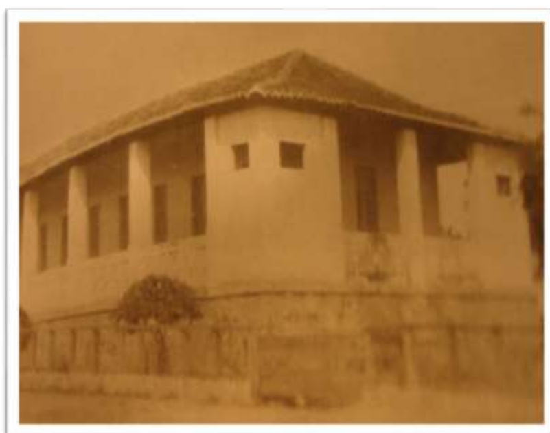
Figura 14. Parte do hospital do acampamento do Orós. Fonte: DNOCS. Orós: o açude da esperança . DNOCS/MVOP:1960.

Também para combater as moléstias que poderiam se expandir entre as famílias residentes nas frentes de trabalho, o DNOCS instalou lactários infantis e centros de puericultura, alinhando-se a um programa especial de atenção à maternidade e à infância, criado em 1940 pelo Ministério da Educação e Saúde via Departamento Nacional da Criança (DNCr). 368 Segundo o relatório de 1951, estes centros de puericultura existiram nas obras maiores e distribuíam leite do FISI, farinhas e vitaminas, especialmente às gestantes e recém-nascidos, com objetivos de diminuir a fraqueza e evitar doenças e mortes, ainda que não fossem suficientes para atender a todos os parentes dos trabalhadores. 369