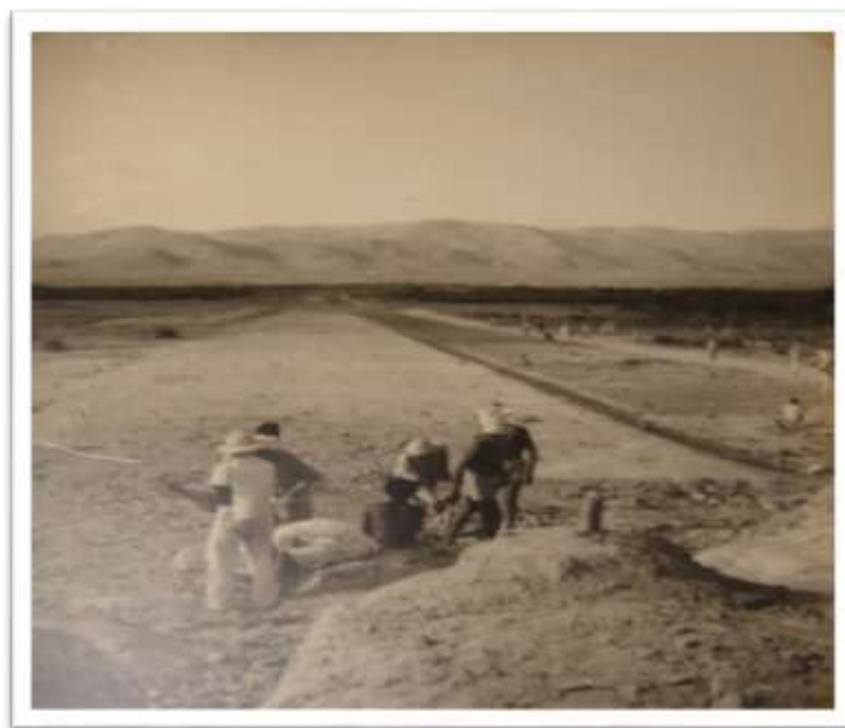
Figura 6. Trabalhadores na construção da estrada de acesso ao açude público Araras (CE) Km 3 (1951).