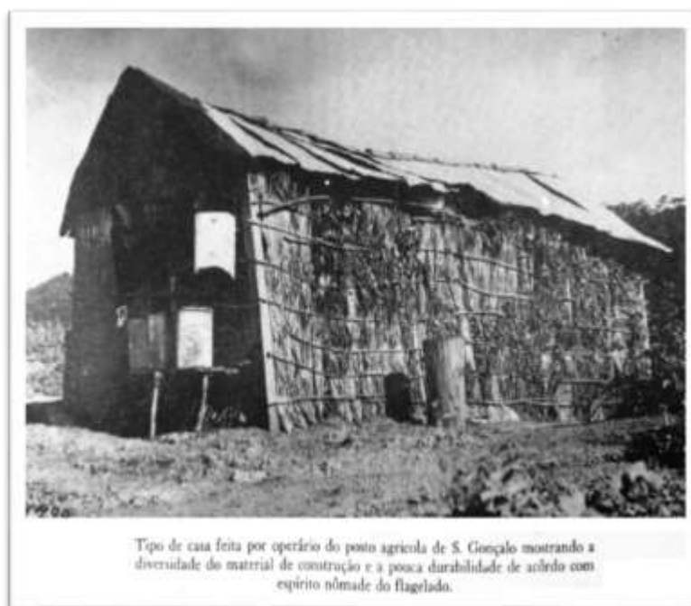
Tipo de casa feita por operário do posto agrícola de S. Gonçalo mostrando a diversidade do material de construção e a pouca durabilidade de acordo com espírito nômade do flagelado.