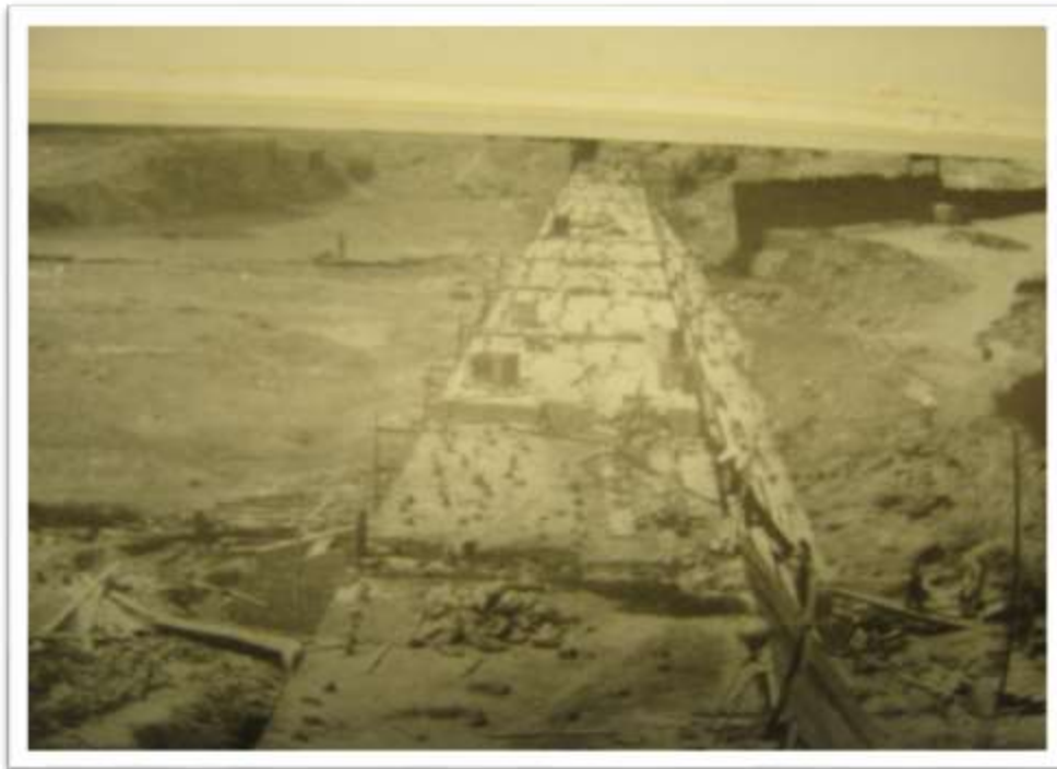
Fotografia 5. Parede açude Quixeramobim (CE).