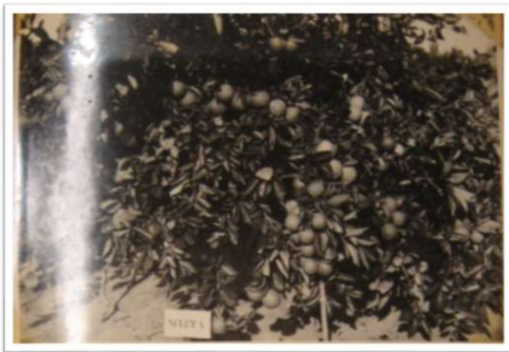
Fotografia 7. Posto agrícola Lima Campos (CE). Laranjeiras