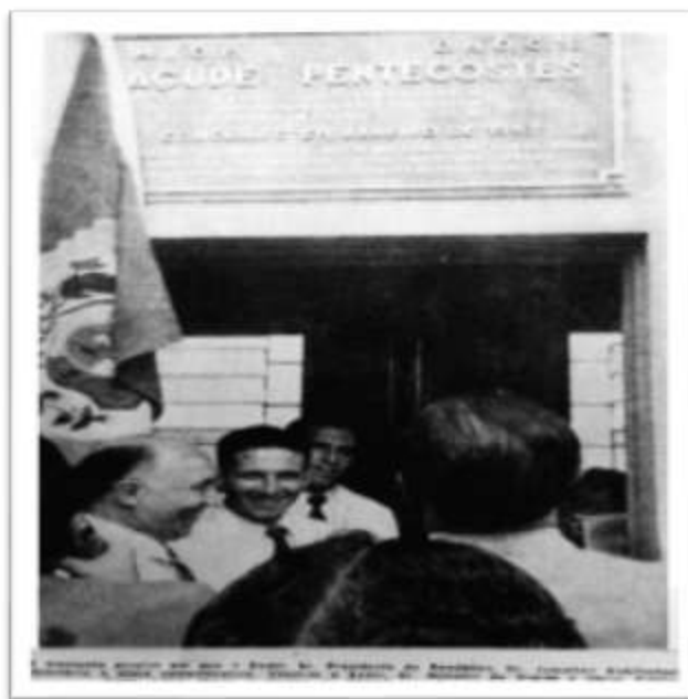
Figura 1. Presidente Juscelino Kubistchek na inauguração do açude Pentecostes.

Pode-se falar também que existia no contexto de criação da SUDENE, de meados ao fim da década de 1950, uma crise política. As discussões eram visivelmente polarizadas entre um grupo que defendia a industrialização do Nordeste, no qual o investimento no solo, e não somente no abastecimento de água, era igualmente importante para resolver os problemas do semiárido, e um grupo que representava as oligarquias agrárias, que temiam perder o poder sobre a vida e o emprego das pessoas. Dessa forma, é possível, em certa medida, pensar que fazendeiros e outras autoridades locais reclamavam obras nos seus municípios para controlar trabalhadores e seu eleitorado, já que o Estado, embora cumprisse com funções assistenciais que o paternalismo que os donos de terras não mais assumia, teria, assim, que respeitar o poder local – que exercia influência direta sobre os eleitores.