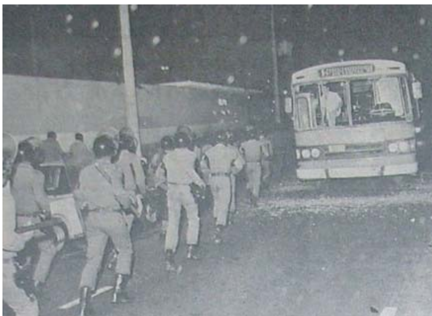
Foto 1. A TARDE 21/08/1981. Ação policial durante o quebra-quebra.