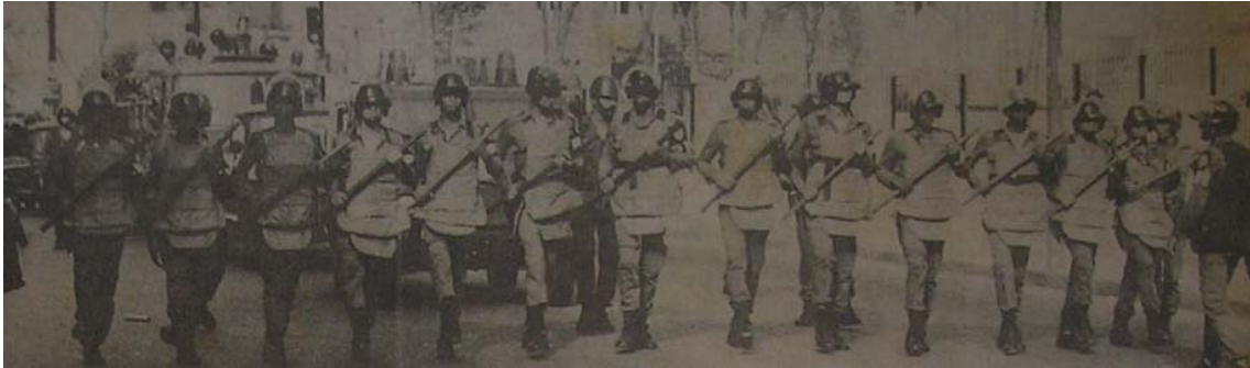
Foto 11. JORNAL DA BAHIA 22/08/1981. Aparato policial nas ruas de Salvador.