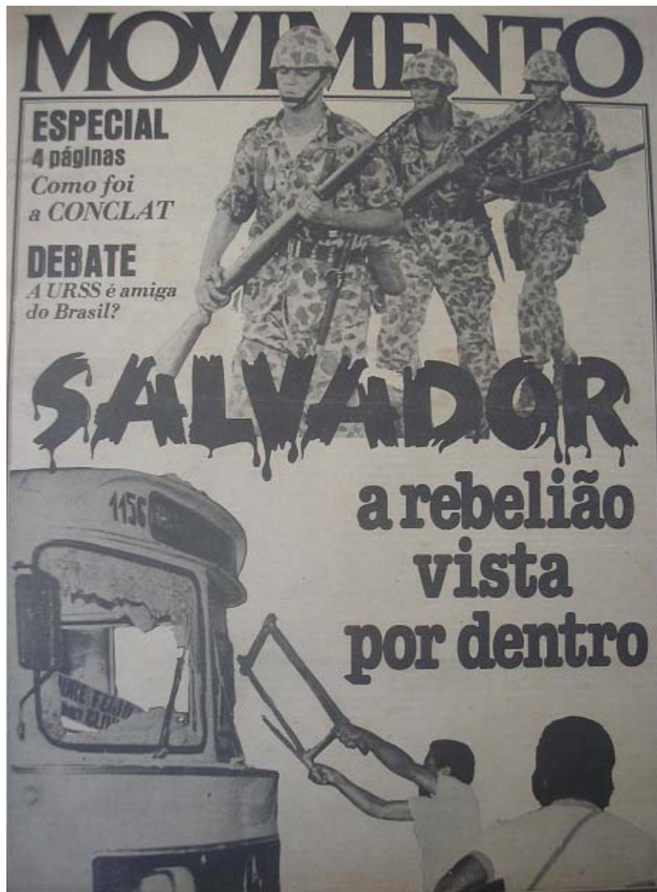
Foto 20. MOVIMENTO 31/08/1981. Capa do jornal sobre o quebra-quebra em salvador.