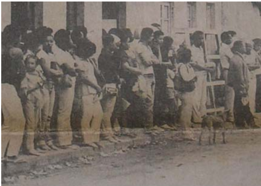
Foto 13. JORNAL DA BAHIA 25/08/1981. Fila e muita espera pelos ônibus.