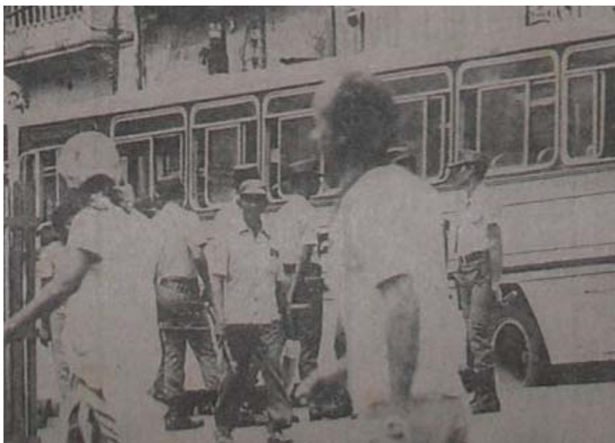
Foto 14. JORNAL DA BAHIA 25/08/1981. Aparato policial nos pontos de ônibus.