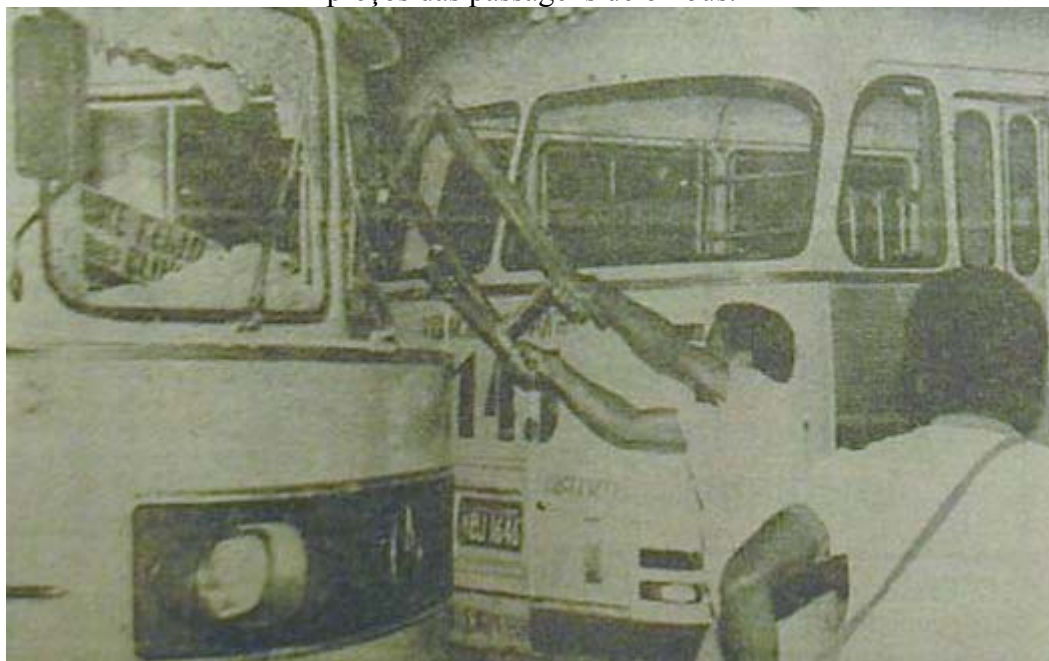
Foto 17. MOVIMENTO 24/08/1981. Manifestante depredando ônibus.