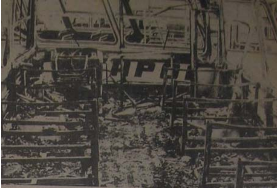
Foto 12. JORNAL DA BAHIA 23/08/1981. Ônibus incendiado.