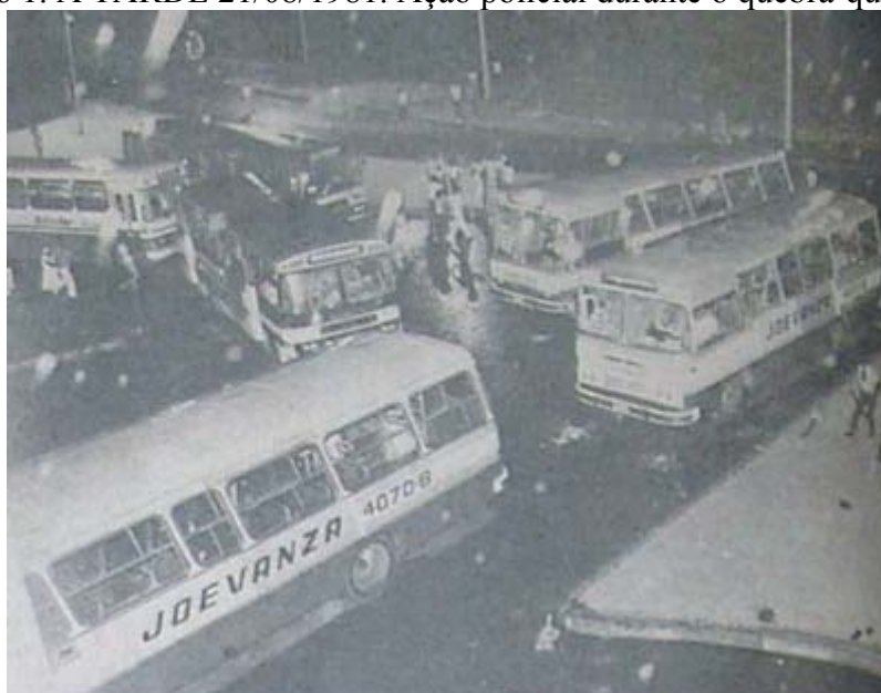
Foto 2. A TARDE 21/08/1981. Ônibus depredados no Terminal do Aquidabã.