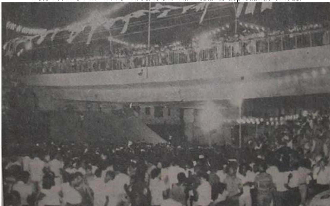
Foto 18. TRIBUNA DA BAHIA 03/09/1981. Inauguração do Viaduto dos Arcos antes da revolta popular.