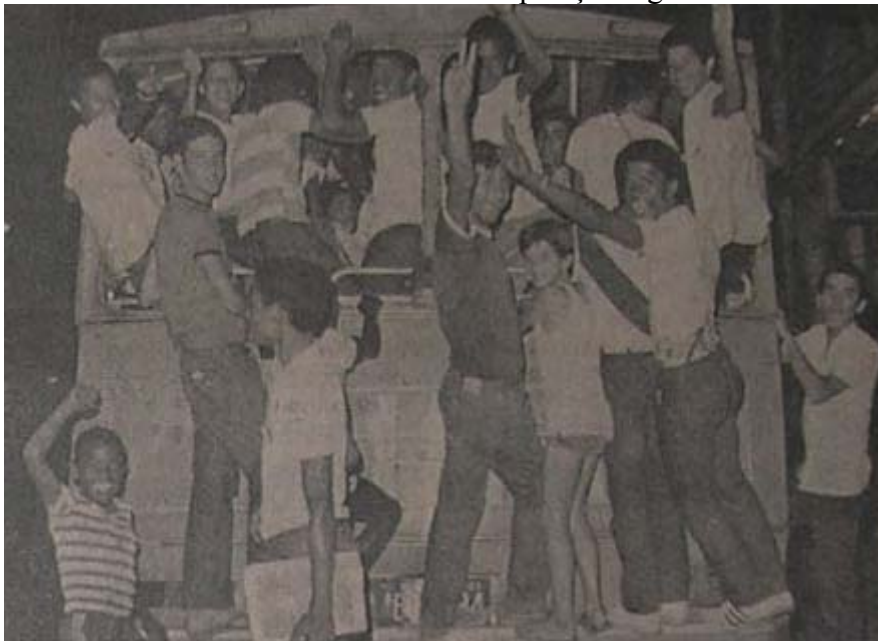
Foto 10. A TARDE 21/08/1981. Jovem se arriscam em ônibus depredado.