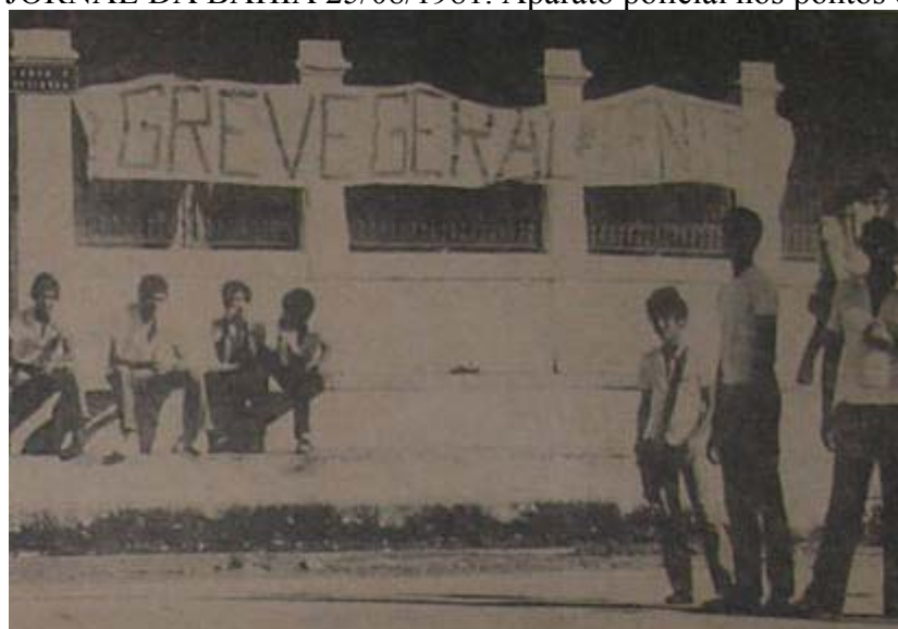
Foto 15. JORNAL DA BAHIA 28/08/1981. Estudantes do Colégio Central em greve.