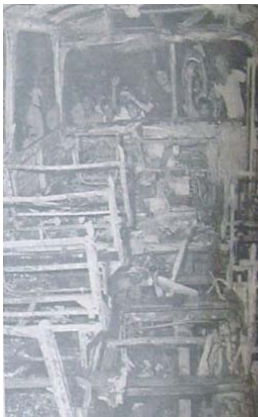
Foto 3. A TARDE 21/08/1981. Ônibus incendiado na quinta-feira da explosão popular.