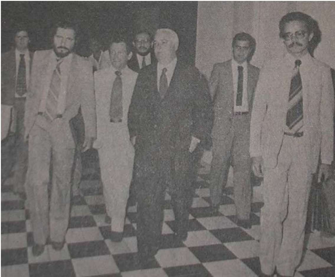
Foto 9. A TARDE 26/08/1981. Reunião entre oposição e governo sobre o aumento.