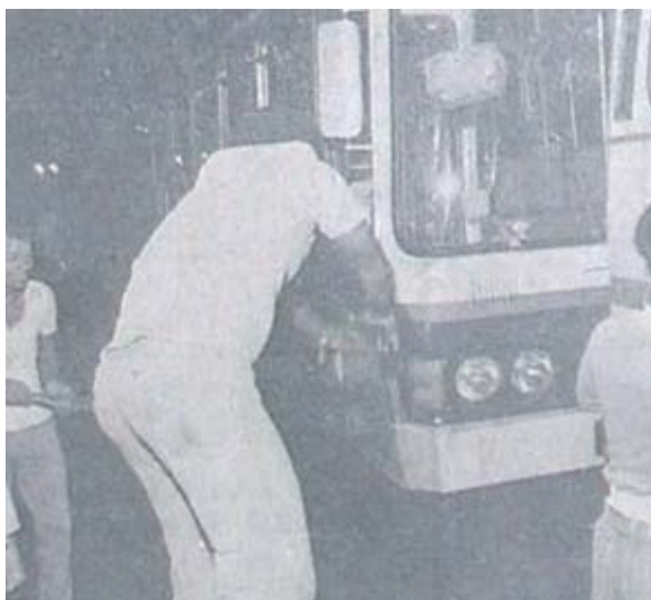
Foto 5. A TARDE 21/08/1981. Manifestante arremessando paralelepípedo contra um ônibus.