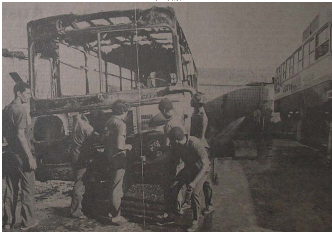
Foto 6. A TARDE 23/08/1981. Ônibus destruído dentro da garagem da Joevanza.