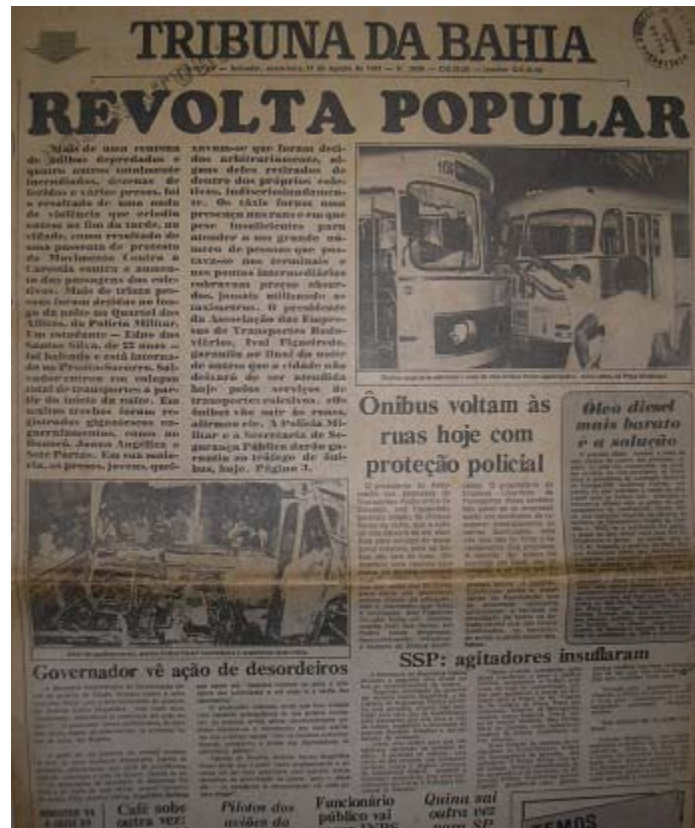
Foto 19. TRIBUNA DA BAHIA DIA 21/08/1981 – capa do jornal sobre a quinta-feira da explosão popular.