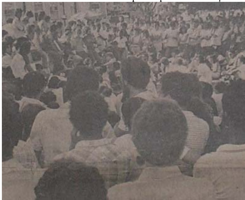
Foto. 8. 27/08/1981. Assembléia estudantil.